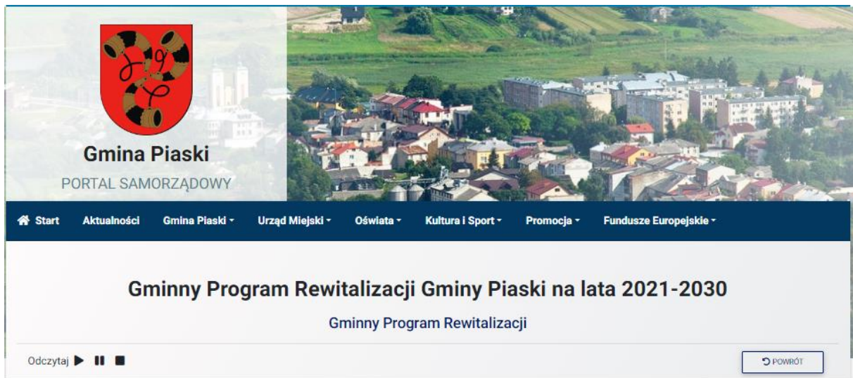
Ryc. 5. Zrzut ekranu – obwieszczenie Burmistrza.

Burmistrz Piask, na podstawie art. 6 ust. 1 i ust. 2 oraz art. 17 ust. 2 pkt 4 ustawy z dnia 9 października 2015 r. o rewitalizacji