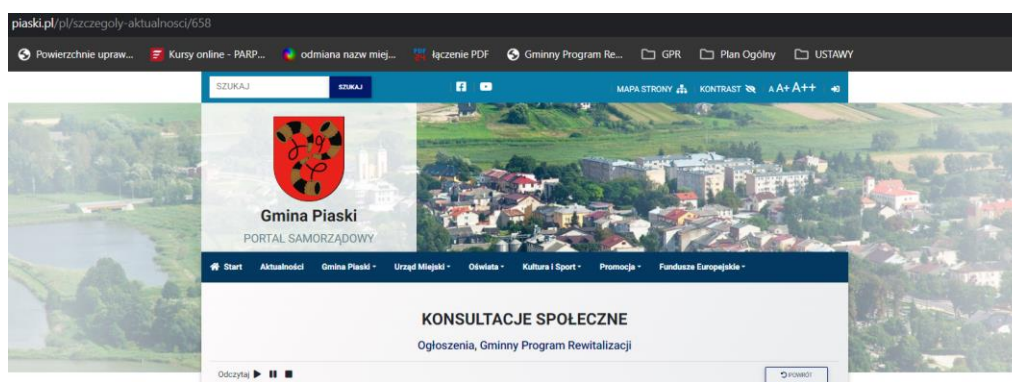
Ryc. 2. Zrzut ekranu – upublicznienie na stronie gminy

W dniu 14 listopada 2024 r. upublicznione zostało ogłoszenie o rozpoczęciu konsultacji społecznych projektu uchwały Rady Miejskiej w Piaskach określającej zasady wyznaczania składu oraz zasady działania Komitetu Rewitalizacji Gminy Piaski . Obwieszczenie to zostało zamieszczone na oficjalnej stronie Gminy (zakładka Gminny Program Rewitalizacji), w Biuletynie Informacji Publicznych, na oficjalnym profilu Facebook-owym Gminy Piaski oraz na tablicach ogłoszeń na terenie Gminy Piaski.