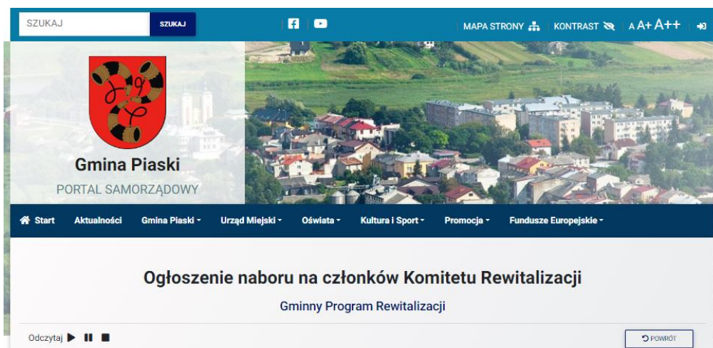
Ryc. 4. Ogłoszenie naboru

W dniu 31 stycznia 2024 r. upublicznione zostało ogłoszenie o rozpoczęciu nabór członków Komitetu Rewitalizacji. Otwarty nabór kandydatów na członków Komitetu rewitalizacji trwał od 01.02.2024 r. do dnia 21.02.2024 r.(włącznie).