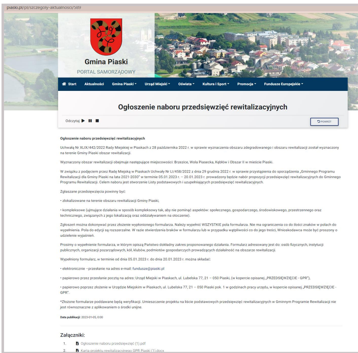
Ryc. 1. Ogłoszenie o naborze kart umieszczone na oficjalnej stronie Gminy Piaski