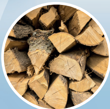
drewnem o wilgotności powyżej 20%